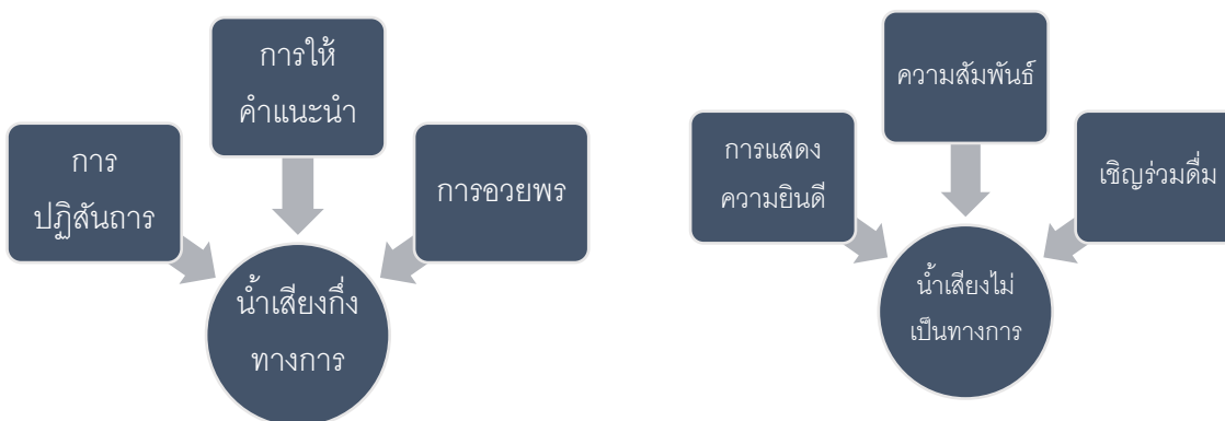
แผนภาพที่ 2.4

น้ำเสียงซึ่งช่วยเสริมความหมายของคำพูด และน้ำเสียงช่วยให้ถ้อยคำที่ผู้สื่อสารมีความน่าสนใจ โทนเสียงที่ใช้แต่ละเหตุการณ์ (communication even) จะมีลักษณะที่ต่างกัน แต่โดยภาพรวมประธานจะใช้น้ำเสียงกึ่งทางการ และไม่เป็นทางการในแต่ละลำดับวัจนกรรมได้แก่ การกล่าวปฏิสันถาร การแสดงความยินดี การบอกความสัมพันธ์ของตนกับเจ้าภาพ การให้คำแนะนำ การอวยพร และการเชิญทุกคนร่วมดื่ม